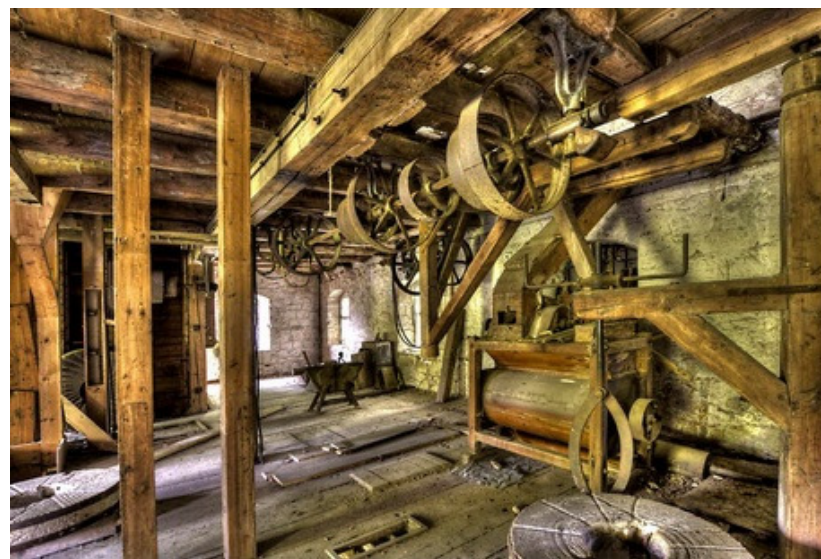
Ausstellung Ma(h)lwerke